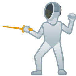
mit Rittern trainieren