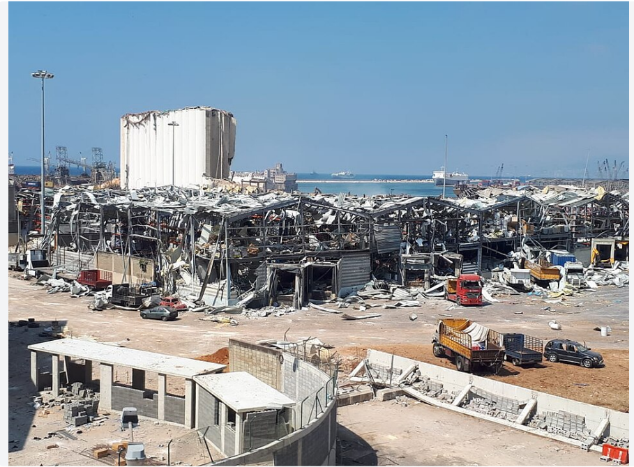
Zerstörungen im Hafen von Beirut nach der Explosion.

Die Explosionskatastrophe im Hafen von Beirut am 4. August 2020 um 18:08 Uhr Ortszeit war ein erschütterndes Ereignis, das die ganze Stadt erschütterte. Ursache war ein Feuer, das durch Schweißarbeiten in einem Lagerraum mit Feuerwerkskörpern entstanden war. Diese Explosion brachte 2750 Tonnen Ammoniumnitrat zur Detonation. Die Sprengkraft wurde auf 1100 Tonnen TNT-Äquivalent geschätzt.