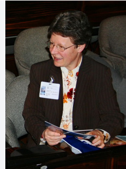
Jocelyn Bell Burnell

Ich bin Jocelyn Bell Burnell, die Entdeckerin der Pulsare. Obwohl ich die erste war, die diese Radiowellen entdeckte, ging der Nobelpreis an meinen Doktorvater Antony Hewish. Diese Ungerechtigkeit war ein herber Schlag, denn meine Arbeit wurde nicht entsprechend gewürdigt. Frauen wurden oft als weniger fähig angesehen, und Männer profitierten von ihren Entdeckungen. Heute wird meine Leistung anerkannt und ich erhalte die Anerkennung, die mir lange verwehrt blieb.